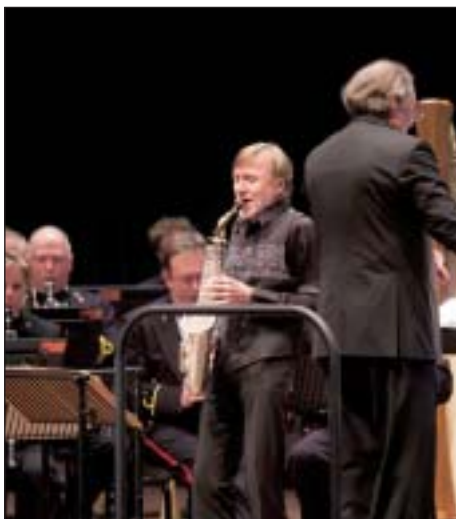
Claude DeLangle en Norbert Nozy.