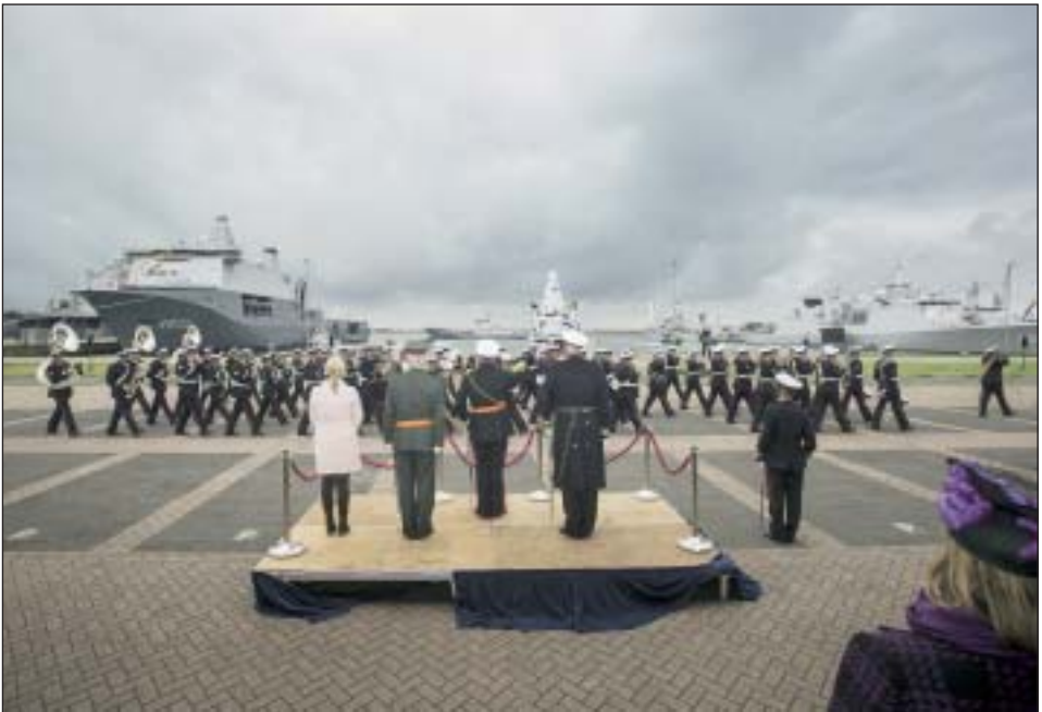
Commando overdracht CZSK