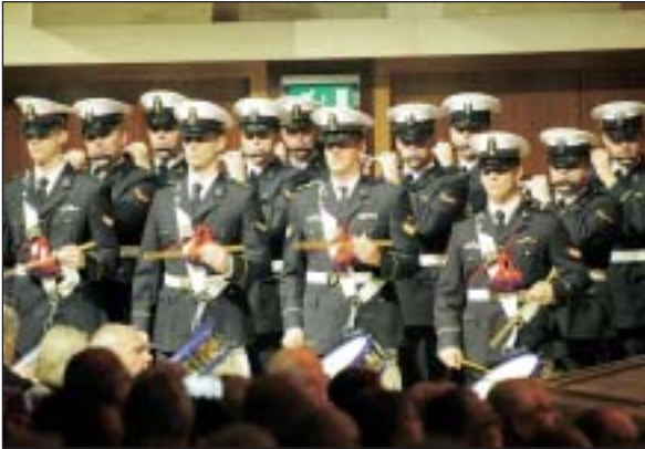
Tamboers en Pijpers.

nadruk legden, iets wat onwennig overkwam. Maar mooie muziek blijft het. Hiermee hadden wij het klassieke deel van vóór de pauze al gehad. Daarin hoort, naar veler smaak, toch bij voorkeur een herkenbaar langer klassiek orkeststuk, al dan niet met solist, als pièce de résistance van de avond. Maar na de Britse topmars 'Royal Salute', met 14 (!) tamboers en pijpers erbij ouderwets martiaal