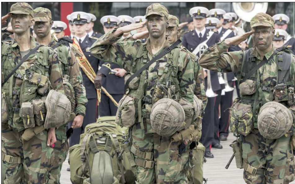
FINEX Rotterdam met vermoeide mariniers op de voorgrond en de kapel op de achtergrond.