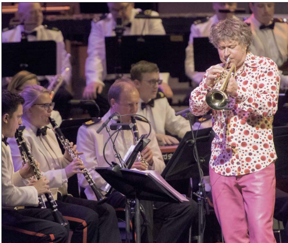
Eric Vloeimans.

Dit voorjaar heeft de kapel weer fijn met verschillende (en nieuwe) solisten kunnen samenwerken. Allereerst werd het rondje langs 10 theaters samen met top-trompettist Eric Vloeimans in Arnhem afgesloten.